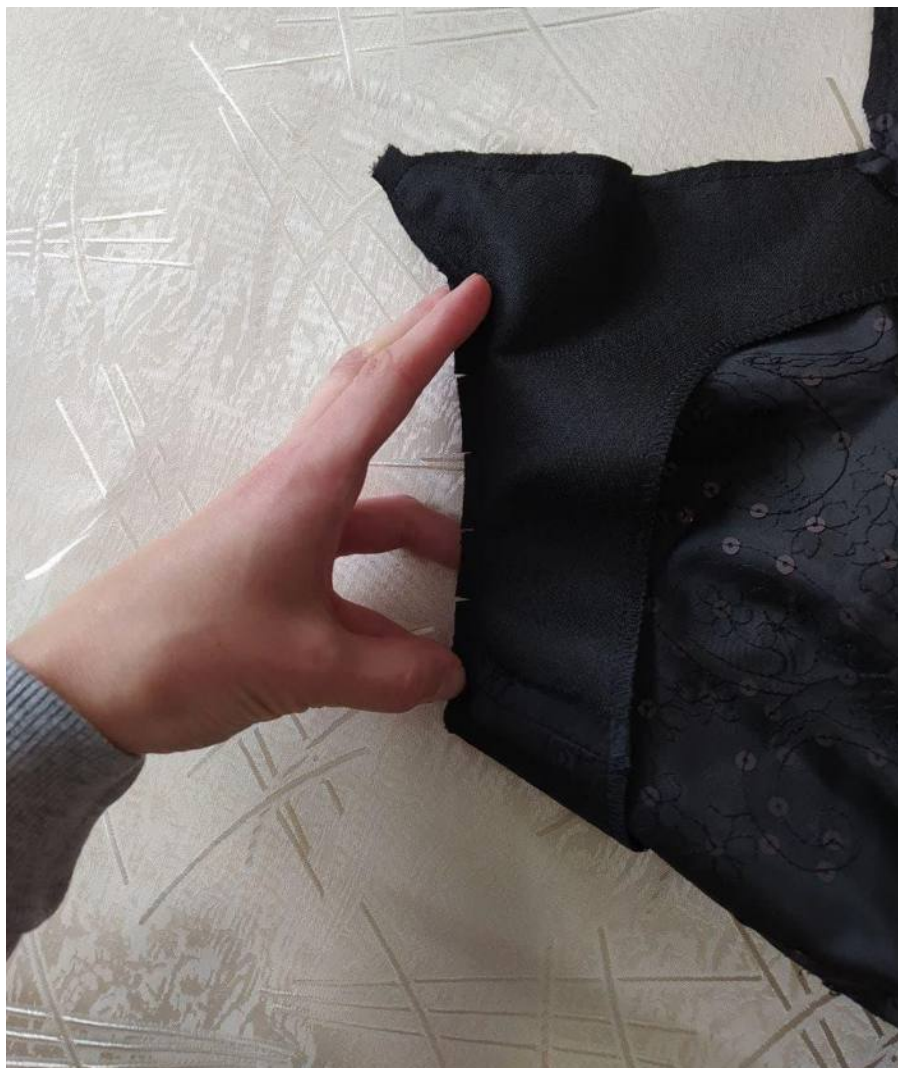
17. Настрочите припуск шва на обтачку.